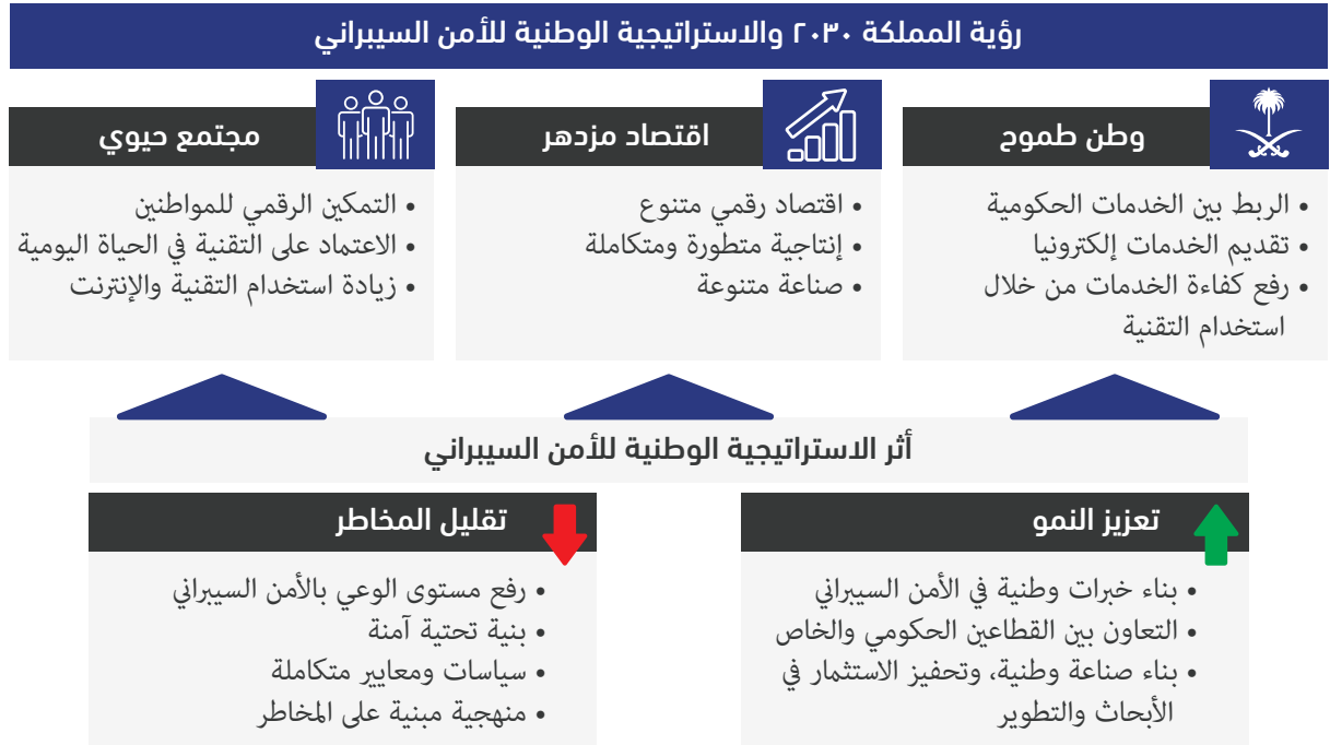
الشكل (١): رؤية المملكة ٢٠٣٠ والاستراتيجية الوطنية للأمن السيبراني

تكاليف الهجمات السيبرانية بشكل أكبر على المستوى العالمي والمحلي؛ مما يدفع الدول لبذل المزيد من الجهود والموارد لإدارة هذه المخاطر بتوازن؛ مع اغتنام فرص التطور والازدهار. وتبعاً لذلك تأتي أهمية تنفيذ هذه الاستراتيجية وتفعيلها في إدارة الفضاء السيبراني في المملكة بوصفها واحدة. إن الرؤية والمبادئ والأهداف في هذه الاستراتيجية توجه جميع الأنشطة ذات العلاقة في المملكة، ومن المتوقع أن توائم الجهات الحكومية والقطاع الخاص أولوياتها، فيما يتعلق بالأمن السيبراني، مع استراتيجية الأمن السيبراني الوطنية، كما ستعمل على ترجمة هذه الاستراتيجية الوطنية، وإطار الأدوار والمسؤوليات،