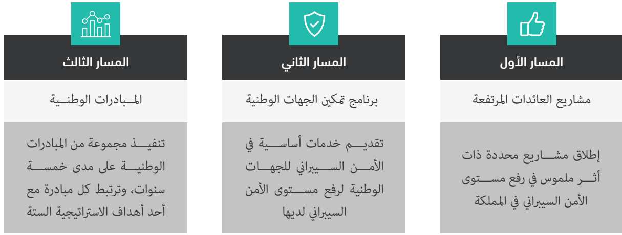
الشكل (٩): مسارات تنفيذ الاستراتيجية