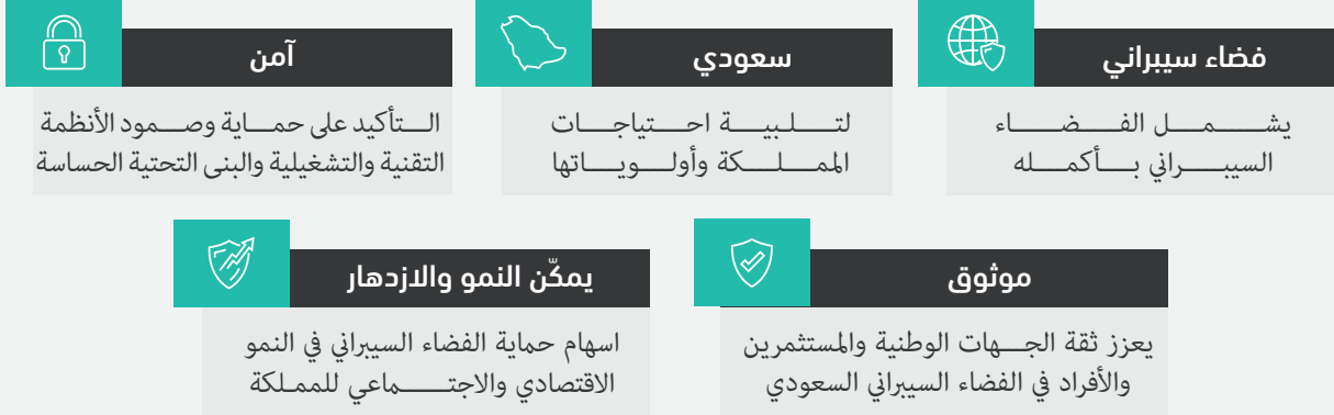
الشكل (5): مكونات الرؤية

وستكون هذه الرؤية شاملة للفضاء السيبراني؛ تُلبّي احتياجات المملكة وأولوياتها وتطلعاتها والتأكيد على حماية الأنظمة التقنية والتشغيلية والبُنى التحتية الحساسة والقدرة على الصمود والتصدي للحوادث السيبرانية وامتصاص الأضرار والتعافي منها في الوقت المناسب. ويوضّح الشكل رقم (5) مكونات الرؤية.