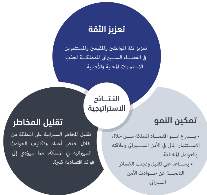
الشكل (٢): النتائج الاستراتيجية

كما تمّ تحديد عناصر الاستراتيجية التي تشمل المبادئ الأساسية للتطوير ورؤية الاستراتيجية وأهدافها، كما تُلقِي الوثيقة الضوء على الأطر الوطنية الموازية للاستراتيجية وأهدافها. وتُقدِّم لمحة عن إطار الأدوار والمسؤوليات للجهات الوطنية، وصولاً إلى الخطة التنفيذية بمساراتها ومبادراتها ومشاريعها ومؤشرات قياس أدائها الرئيسية.