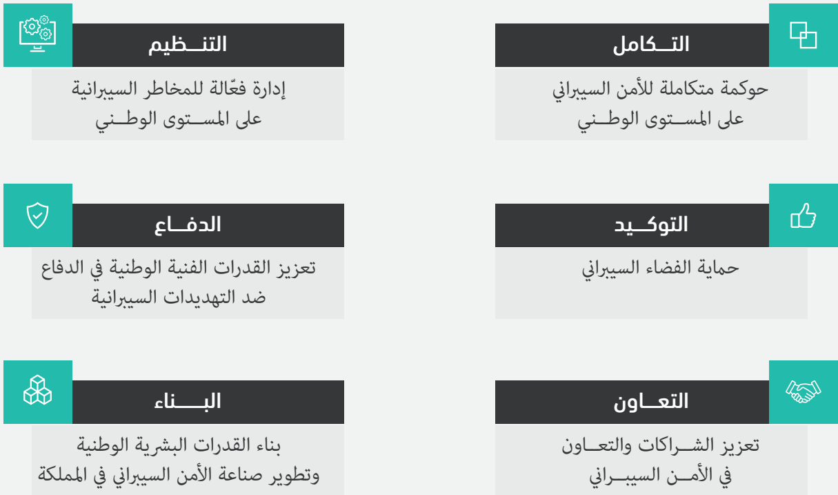
الشكل (6): الأهداف الاستراتيجية

من أجل الوصول إلى فضاء سيبراني سعودي آمن وموثوق، يمكّن النمو والازدهار؛ تسعى الاستراتيجية الوطنية للأمن السيبراني إلى تحقيق ستة أهداف رئيسية، ويوضح الشكل رقم (6) الأهداف الاستراتيجية: