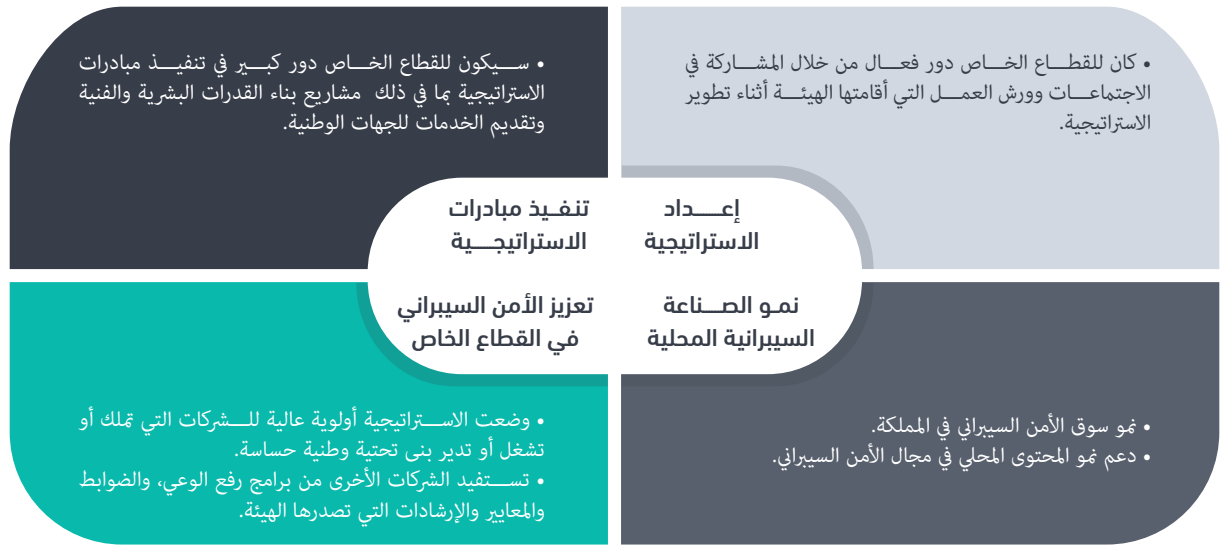
الشكل (٨): القطاع الخاص

يعتبر القطاع الخاص من العناصر الأساسية لمنظومة الأمن السيبراني، وله دور أساسي في تعزيز الأمن السيبراني، وقد روعي ذلك في كافة الجوانب، ويشمل ذلك: