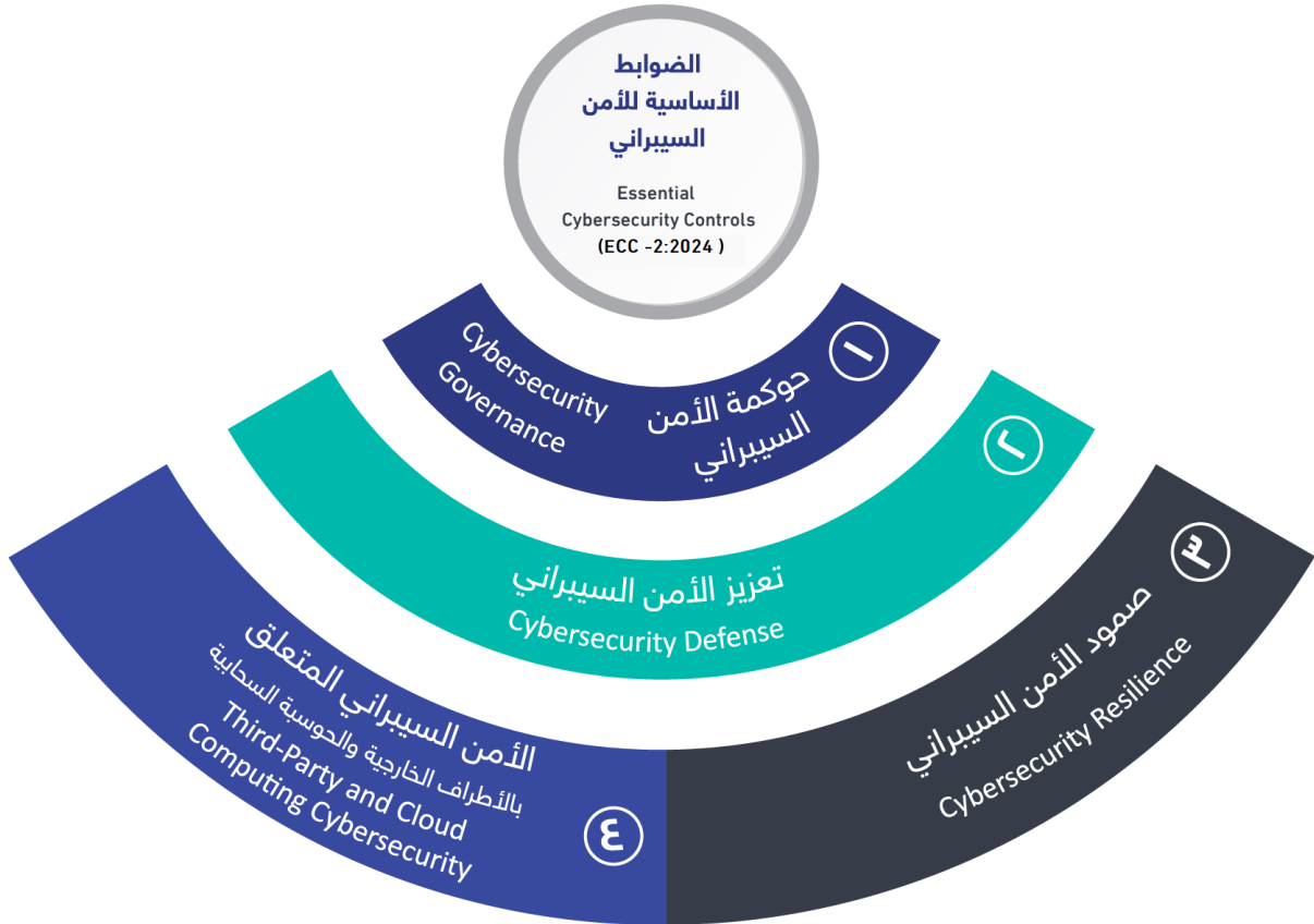
شكل (١): المكونات الأساسية للضوابط

يوضح الشكل (١) أدناه المكونات الأساسية للضوابط.